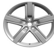
45th Edition - 20" disky kol z lehkých slitin; pneumatiky - přední 245/45 R20, zadní 275/40 R20