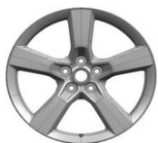
20" disky kol z lehkých slitin; pneumatiky - přední 245/45 R20, zadní 275/40 R20