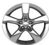
Leštěné 20" disky kol z lehkých slitin; pneumatiky - přední 245/45 R20, zadní 275/40 R20